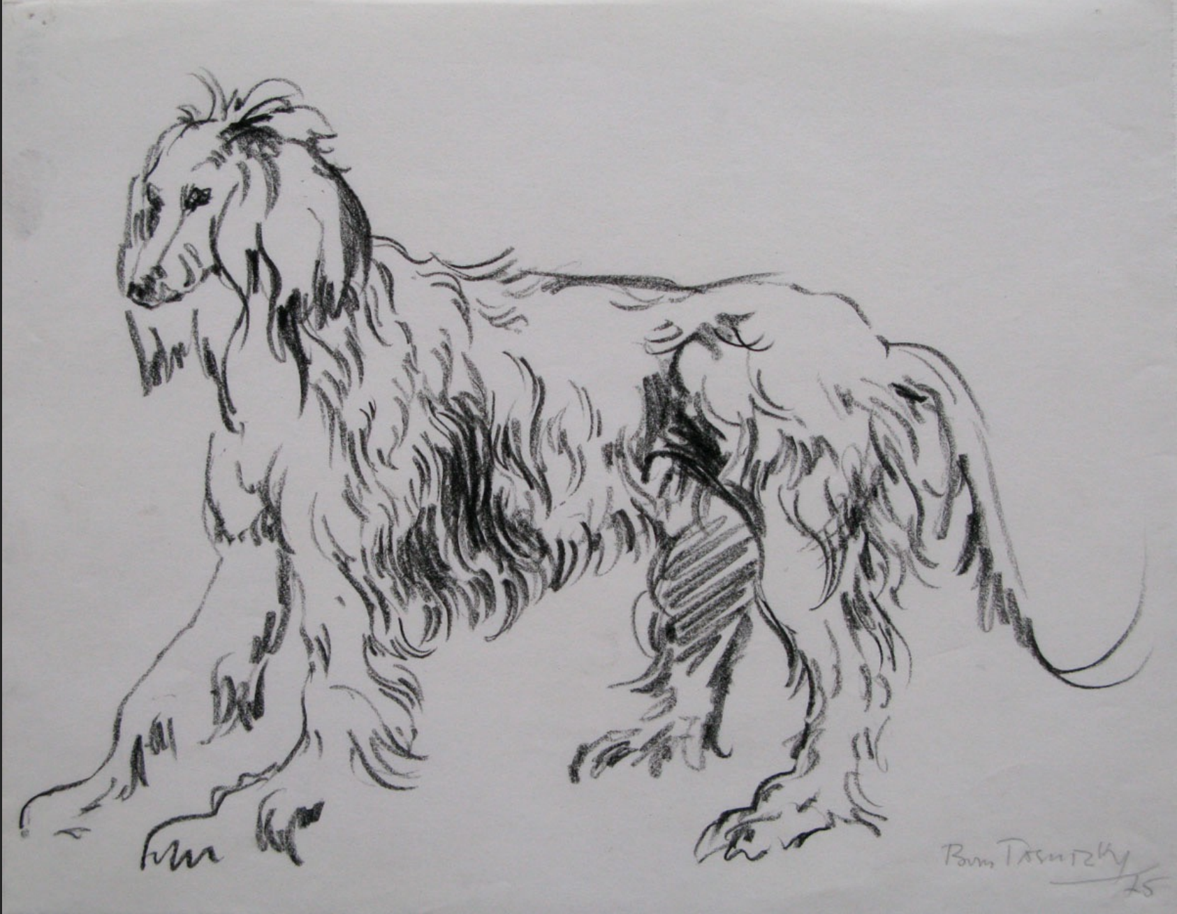
LÉVRIER -5-, 1975, fusain, 22,5 x 28,2 cm