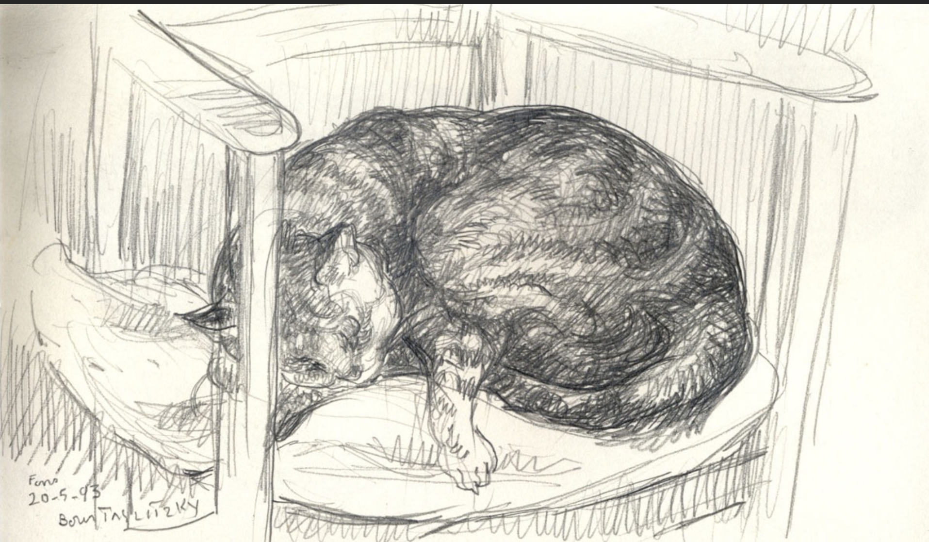
FONS -1-, 20 mai 1993, crayon, 12,7 x 21,5 cm