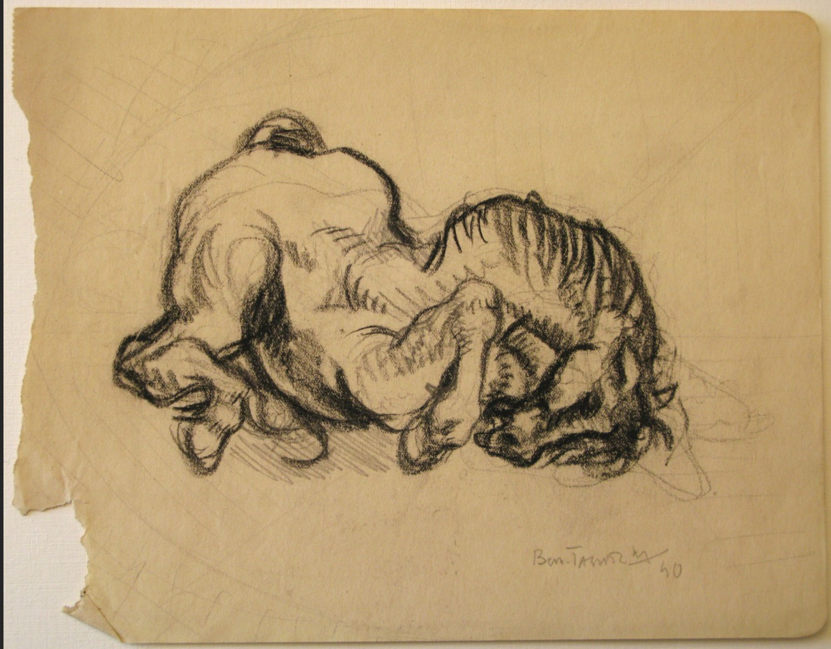
CHEVAL À TERRE (PG70), 1940, fusain sur papier, 18 x 23 cm