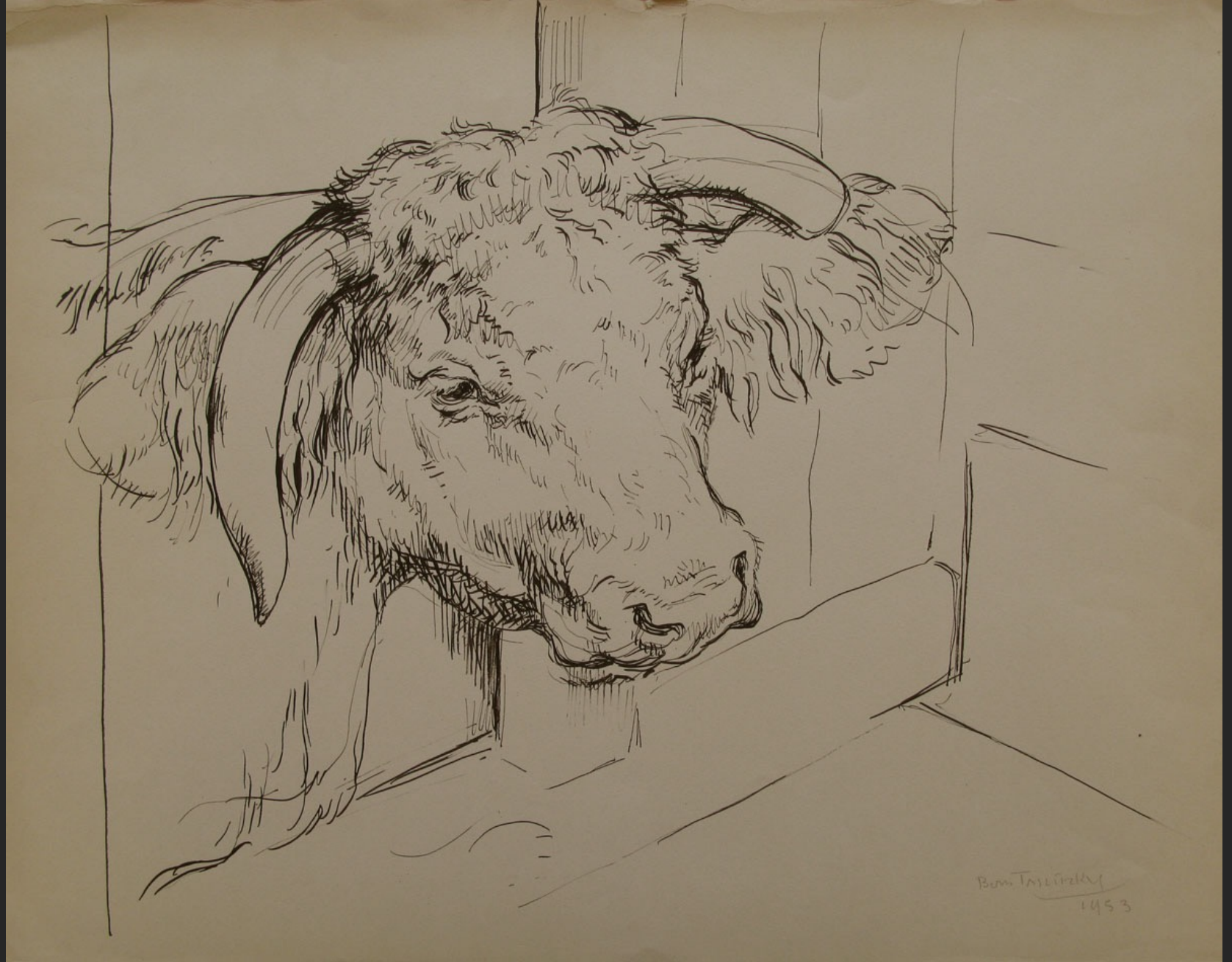
TÊTE DE BOVIN, 1953, encre, 37,5 x 47,7 cm