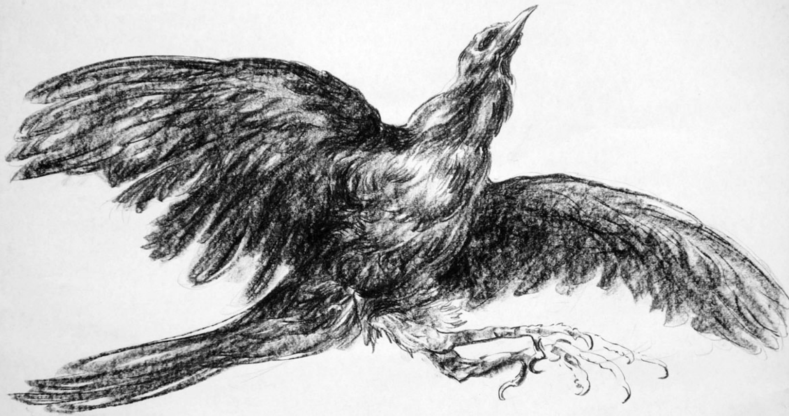
OISEAU EN VOL III, 1975, fusain, 45 x 56 cm