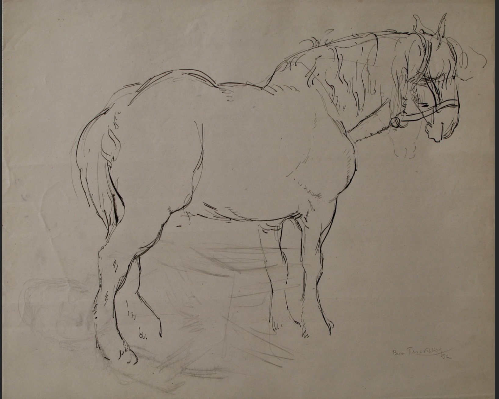
CHEVAL, 1952, encre, 43 x 52,5 cm