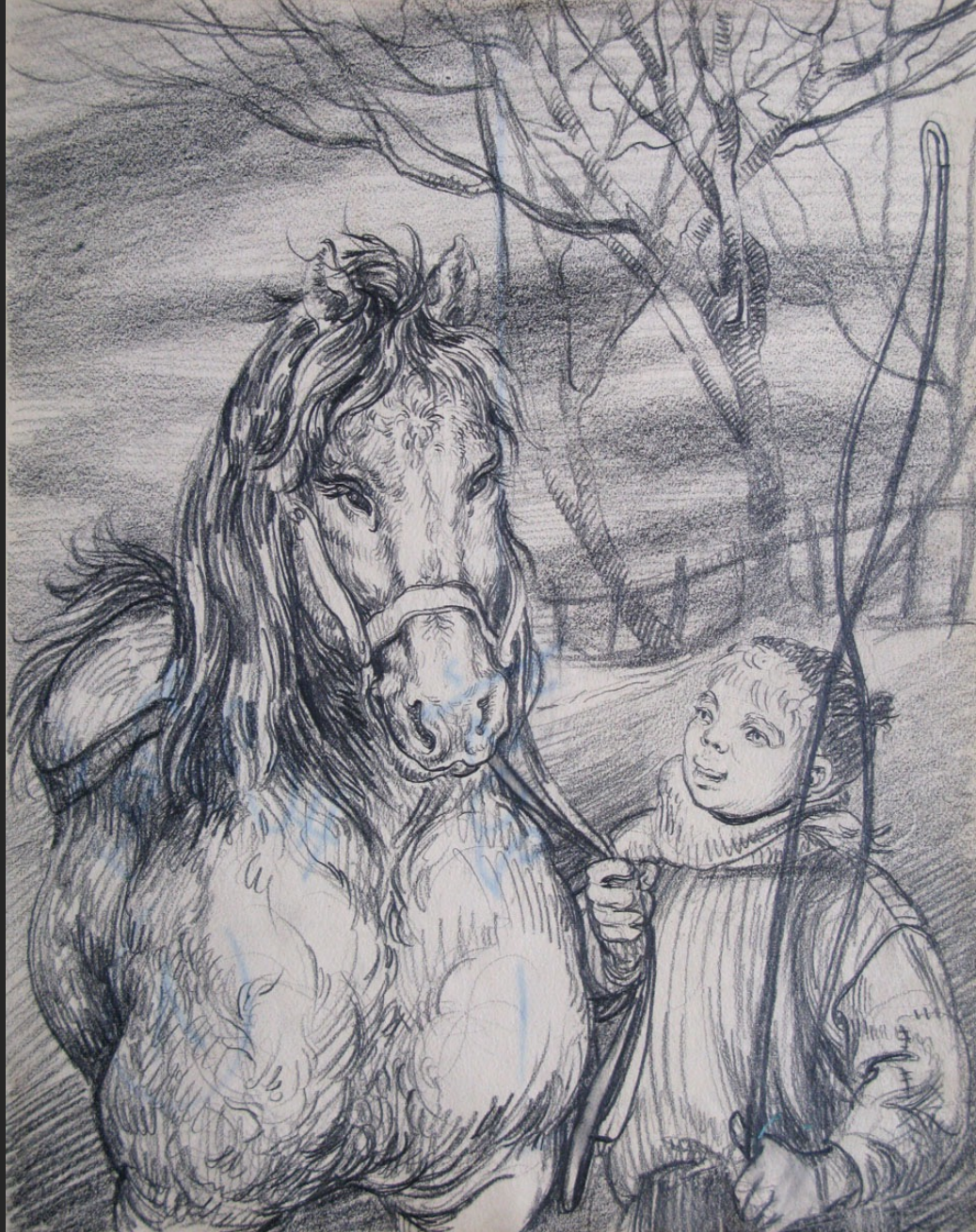
CHEVAL ET ENFANT (PELLÉ LE CONQUÉRANT N°12), non signé, non daté, crayon, 28,8 x 23 cm