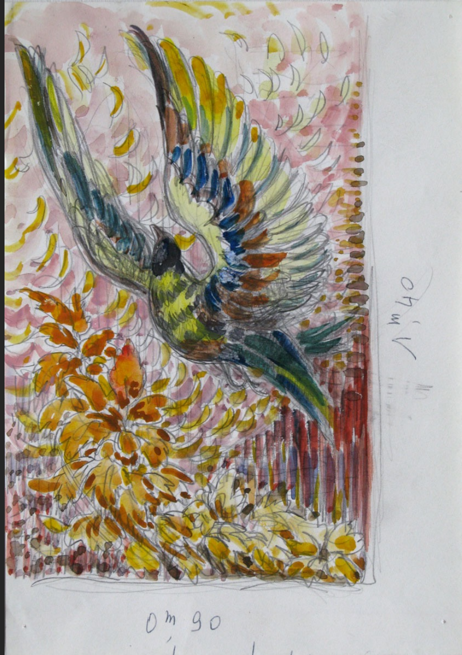
ÉTUDE D'OISEAUX POUR BÉTON GRAVÉ -7-, non daté, crayon et aquarelle, 19,5 x 14 cm