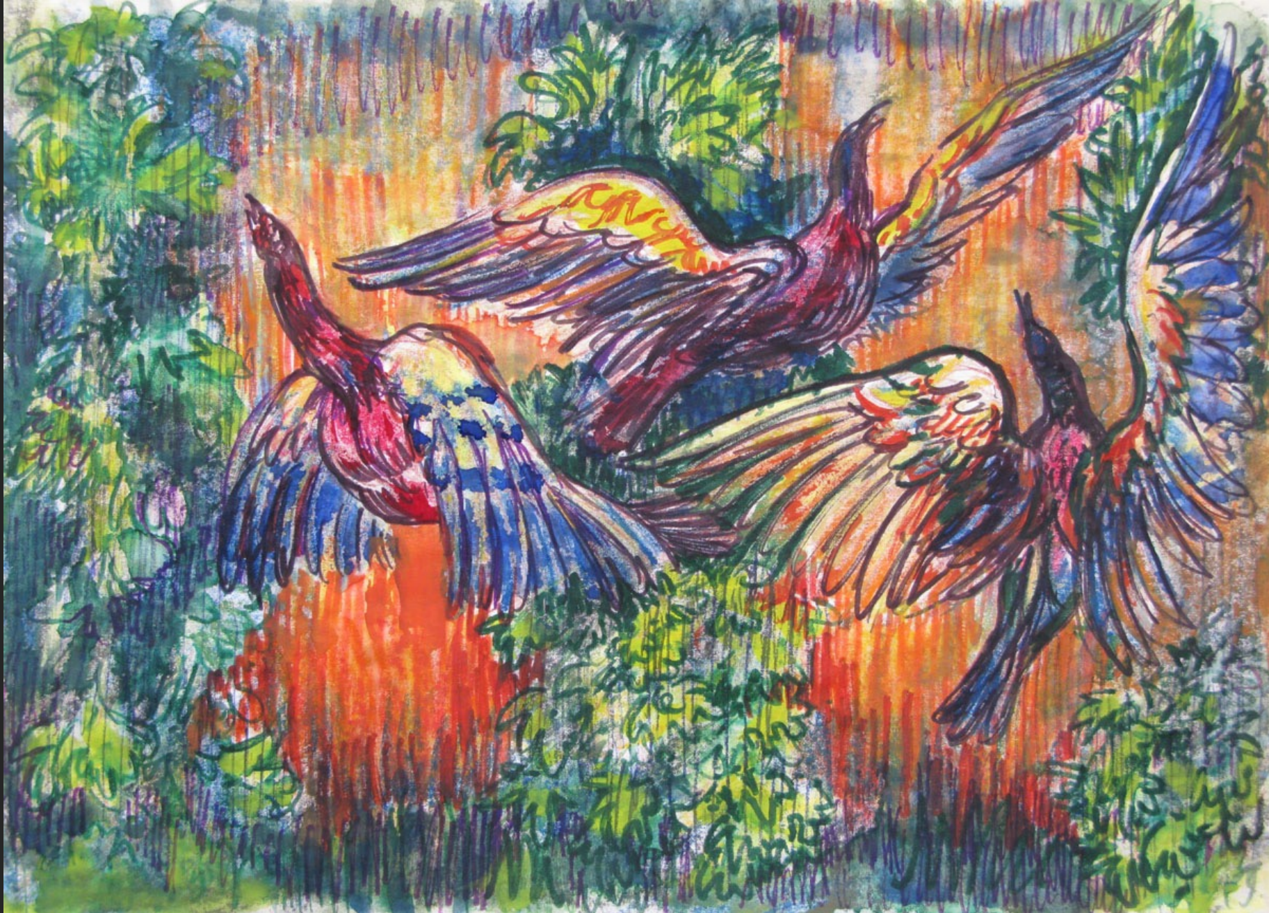
ÉTUDE D'OISEAUX POUR BÉTON GRAVÉ, 2 octobre 1976, crayon, 29,7 x 21 cm