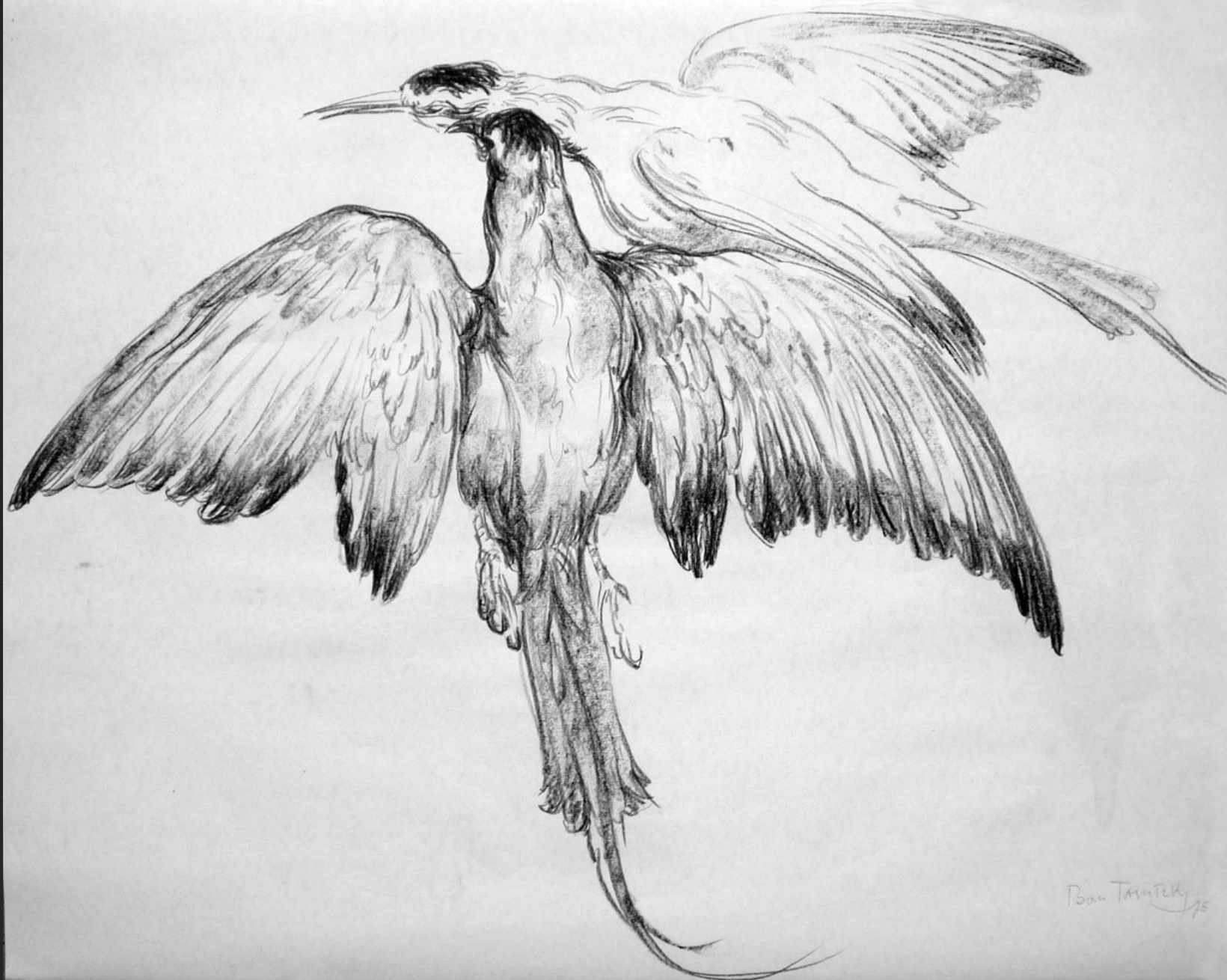
DEUX OISEAUX EN VOL III, 1975, fusain, 45 x 56 cm