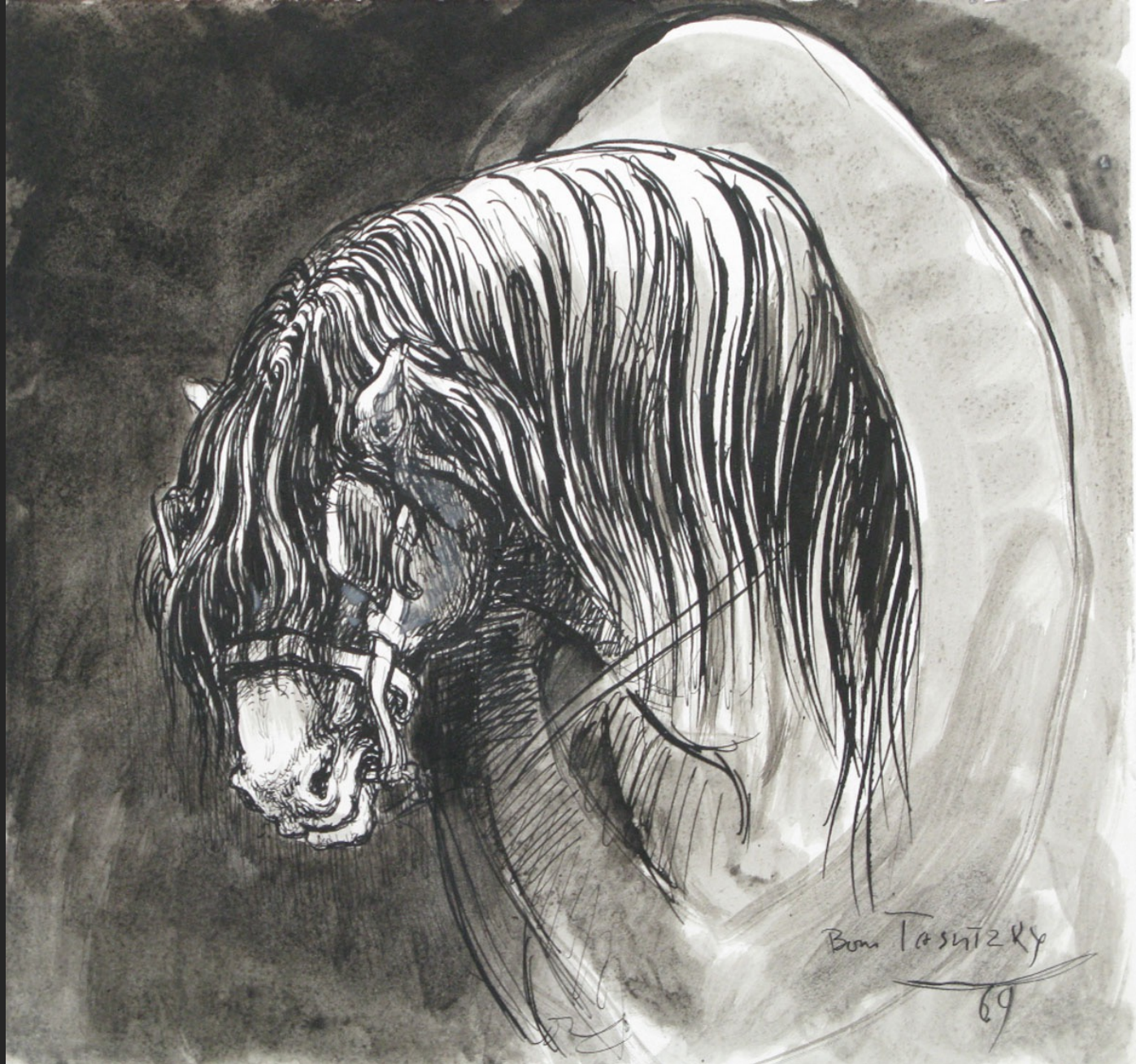
TÊTE DE CHEVAL, 1969, lavis sur papier, 21,8 x 23 cm