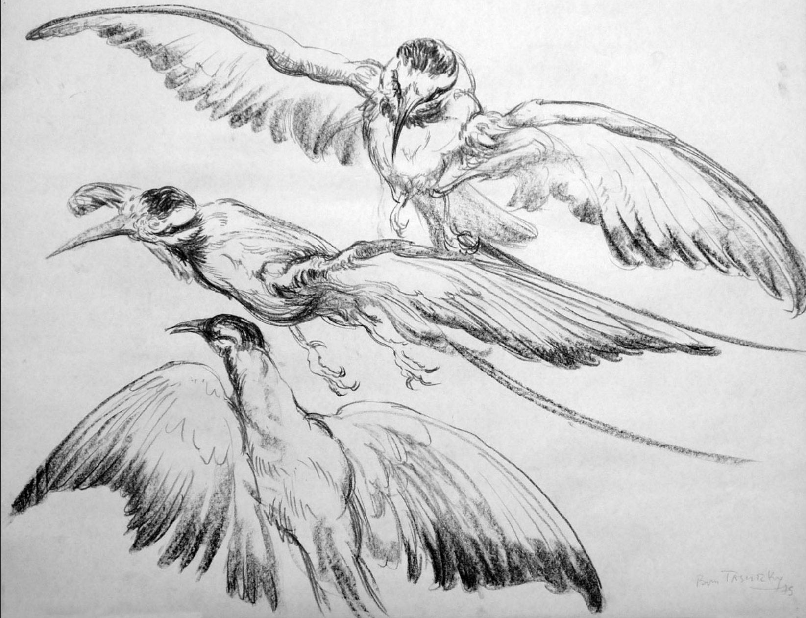
TROIS OISEAUX EN VOL III, 1975, fusain, 45 x 56 cm