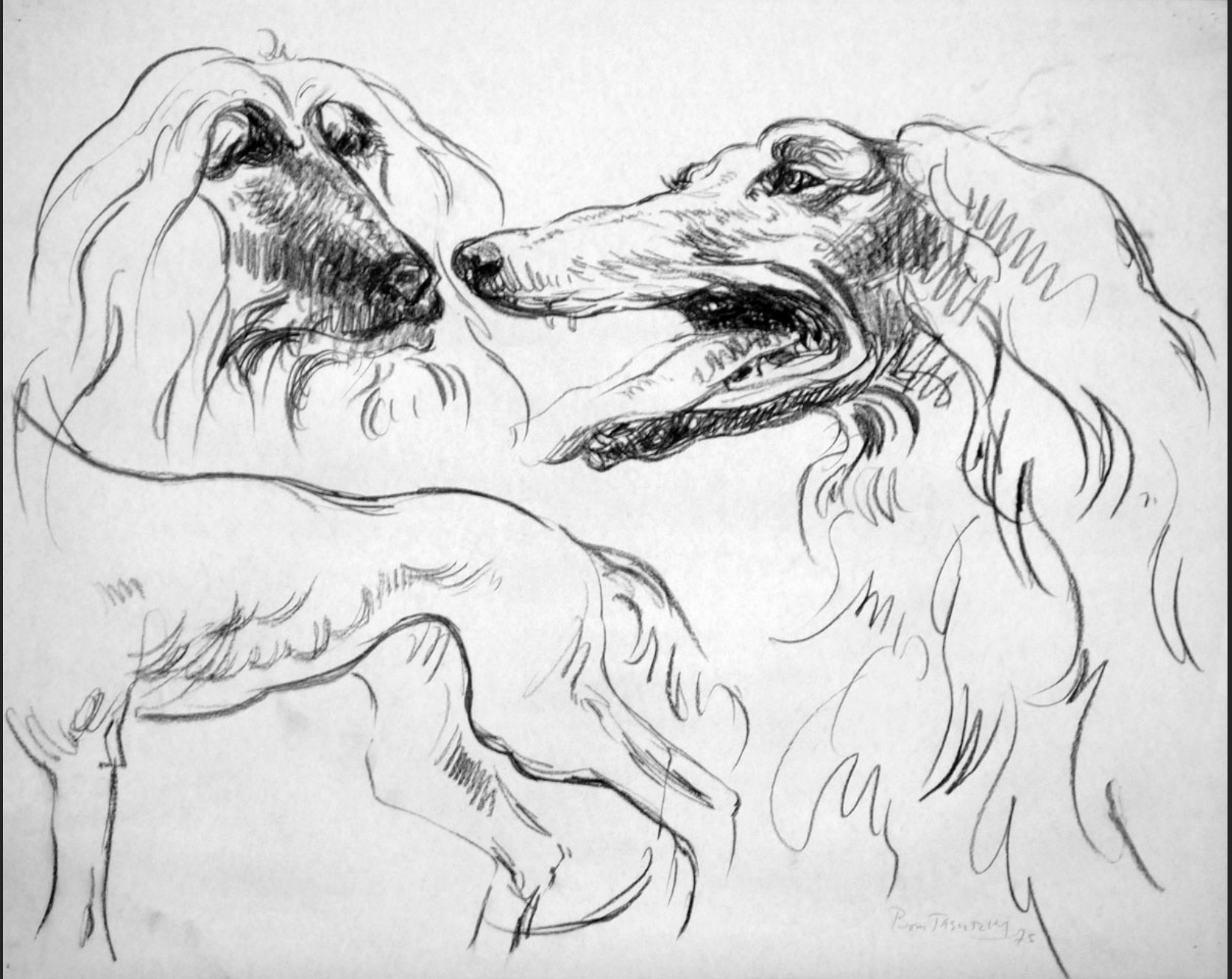
ÉTUDE CHIEN, 1975, fusain, 45 x 56,5 cm