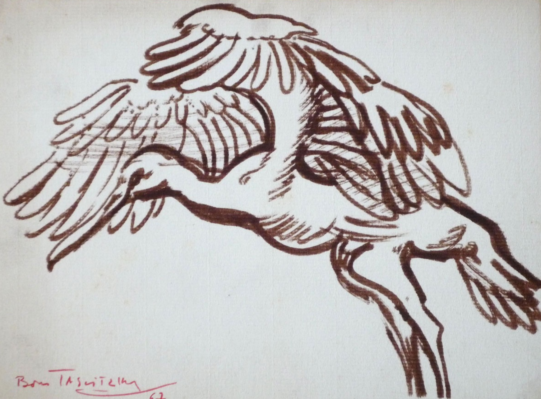
OISEAU, 1967, lavis brun sur carton, 17,5 x 23,5 cm