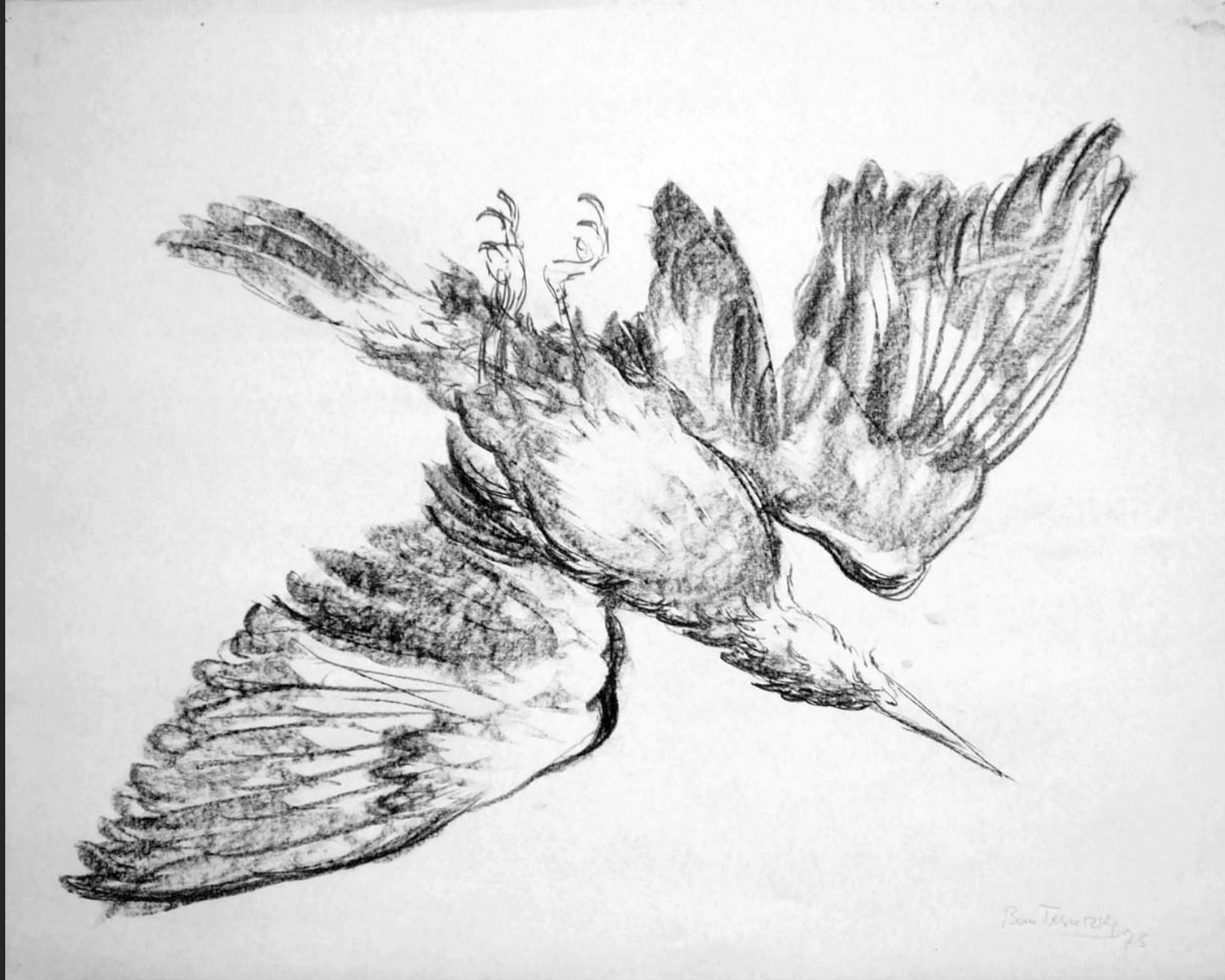
OISEAUX AILES DÉPLOYÉES I, 1975, fusain, 45 x 56 cm