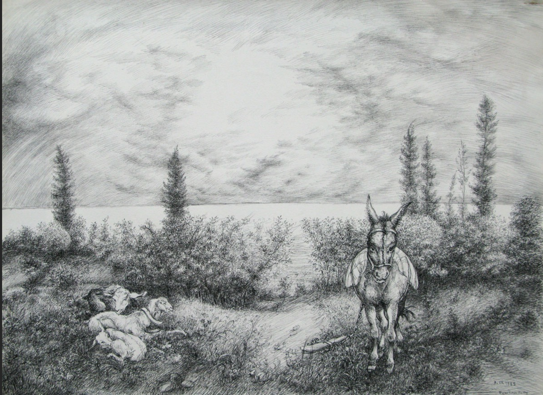
ÂNE ET CHÈVRES, 7 novembre 1985, encre, 56,4 x 76,2 cm