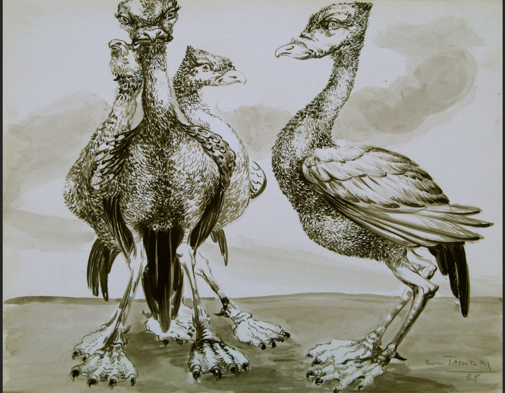
QUATRE GRANDS OISEAUX, 1968, encre et lavis, 32,7 x 41,6 cm