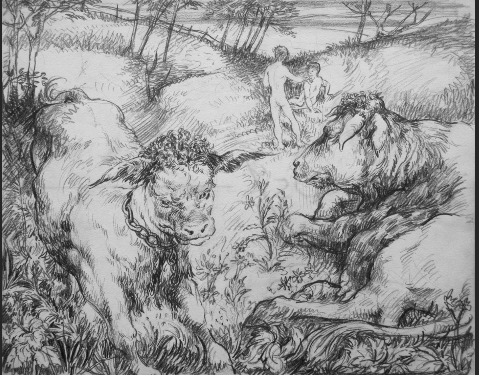
TAURILLONS ET ENFANTS (PELLÉ LE CONQUÉRANT n°13), non signé, non daté, crayon, 23 x 28,8 cm