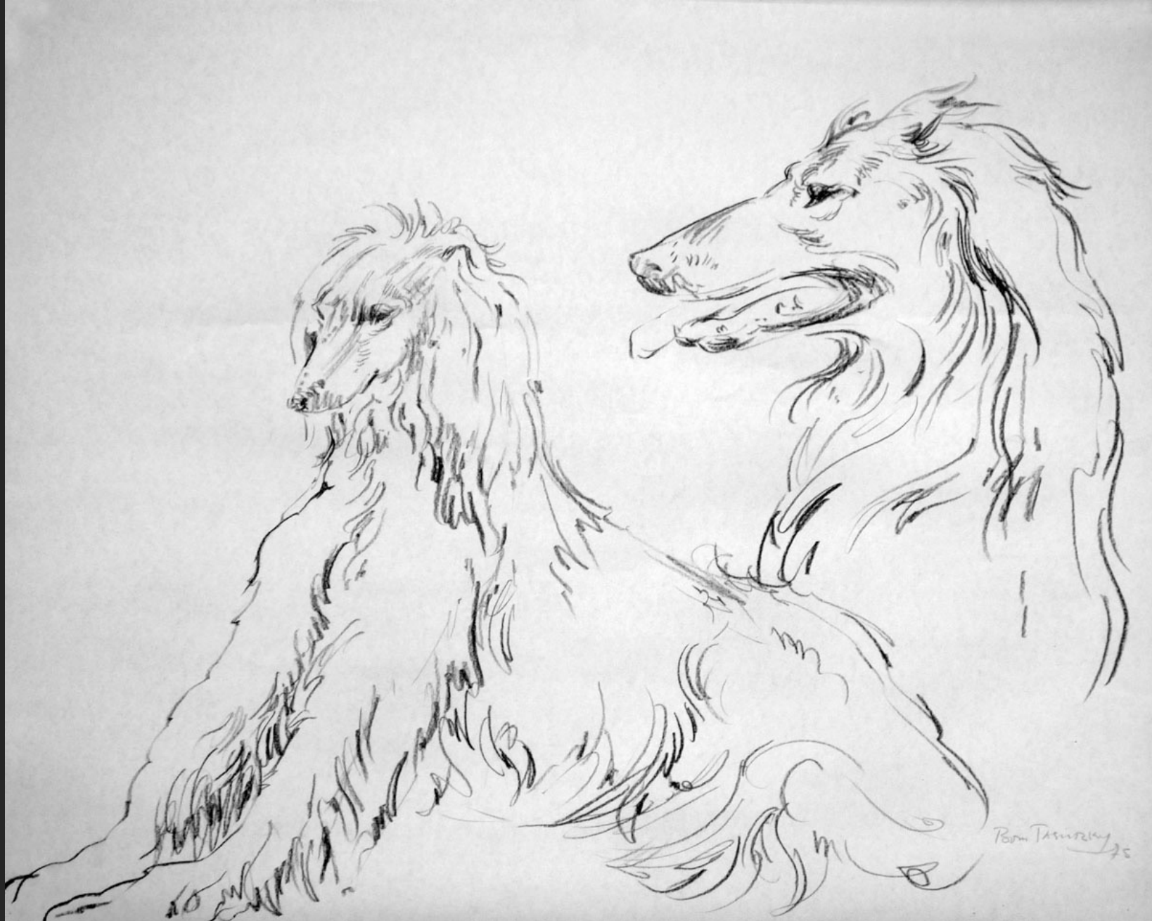
DEUX CHIENS I, 1975, fusain, 45 x 56,5 cm