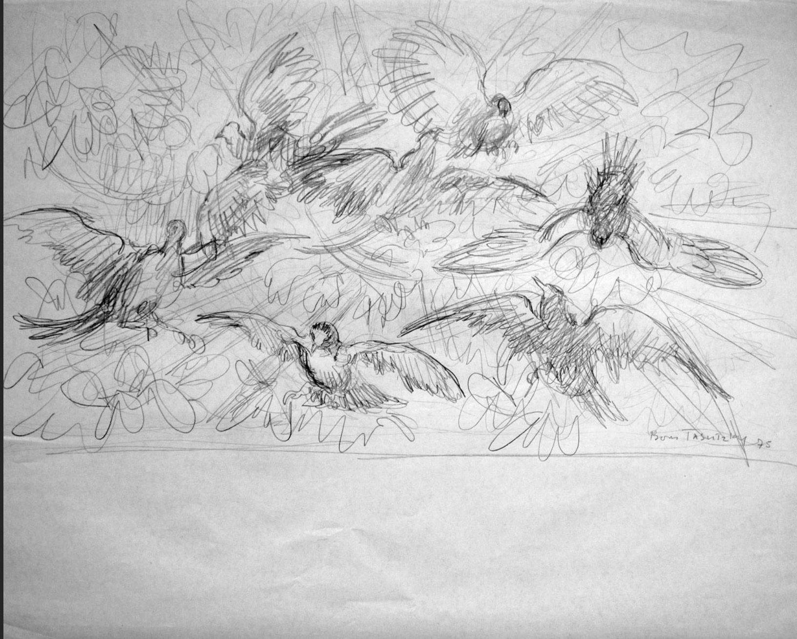
ENVOLS D'OISEAUX, CROQUIS, 1975, fusain, 45 x 56,5 cm