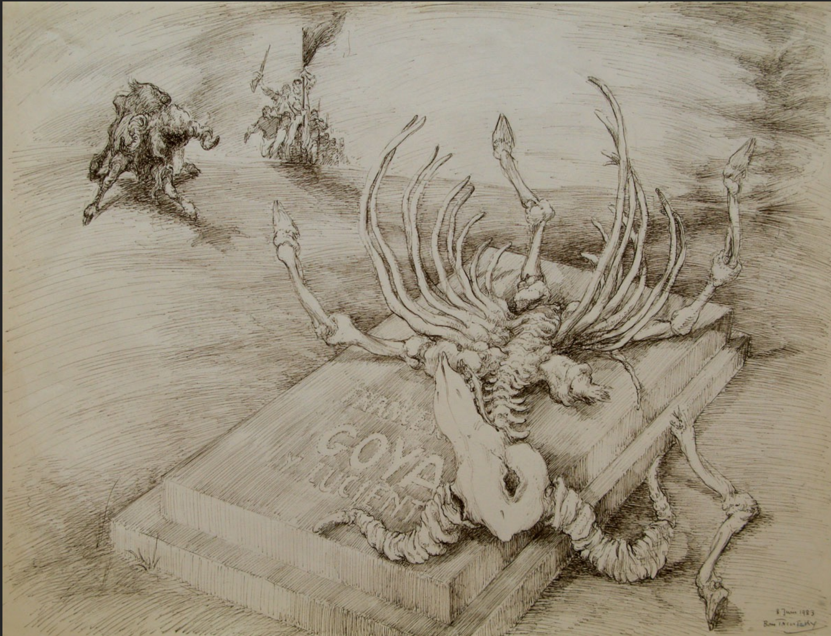
LE GRAND BOUC -20-, 8 juin 1983, encre, 48 x 63,5 cm