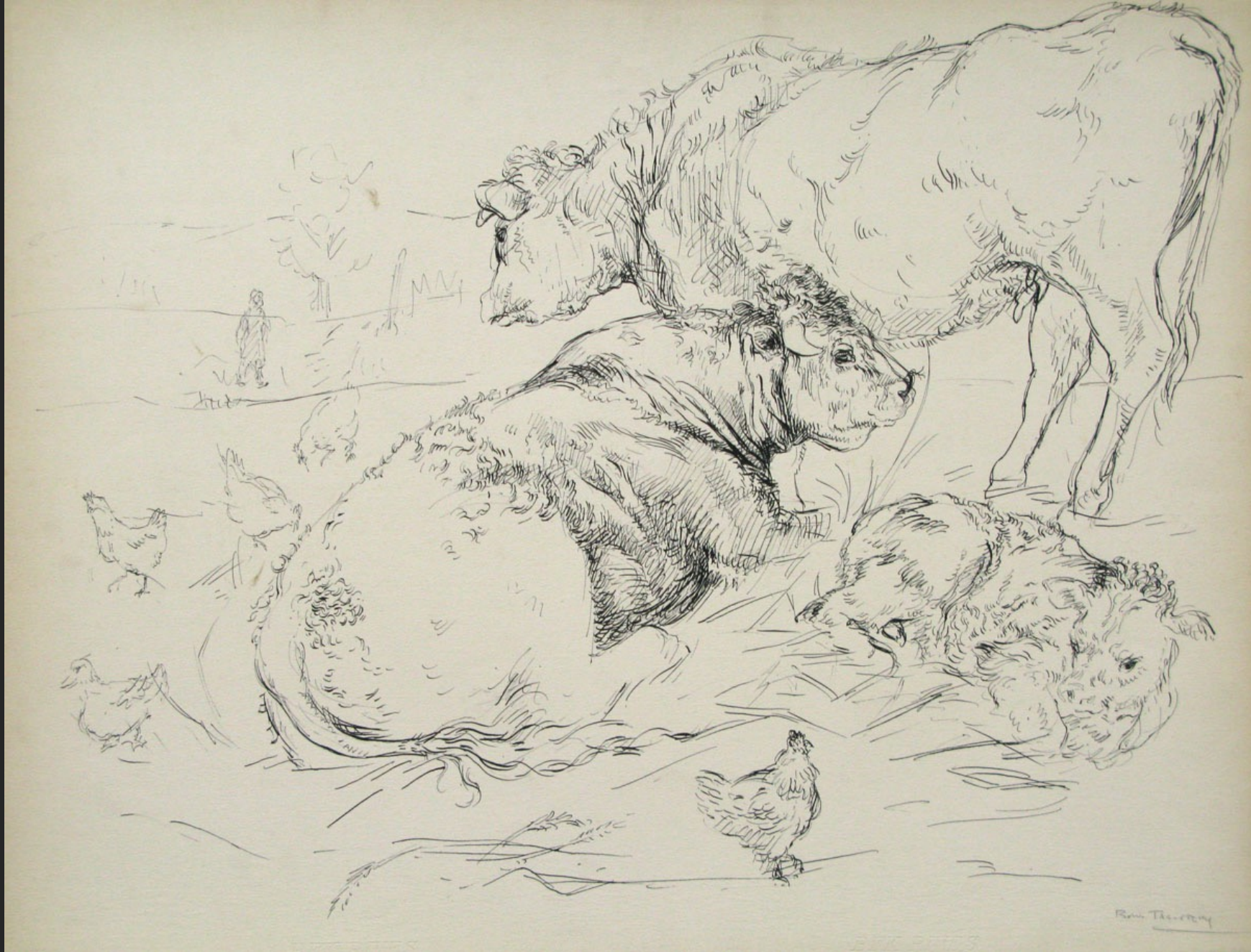
JEUNES TAUREAUX ET VACHE n°11, non daté, encre, 49,7 x 64,8 cm