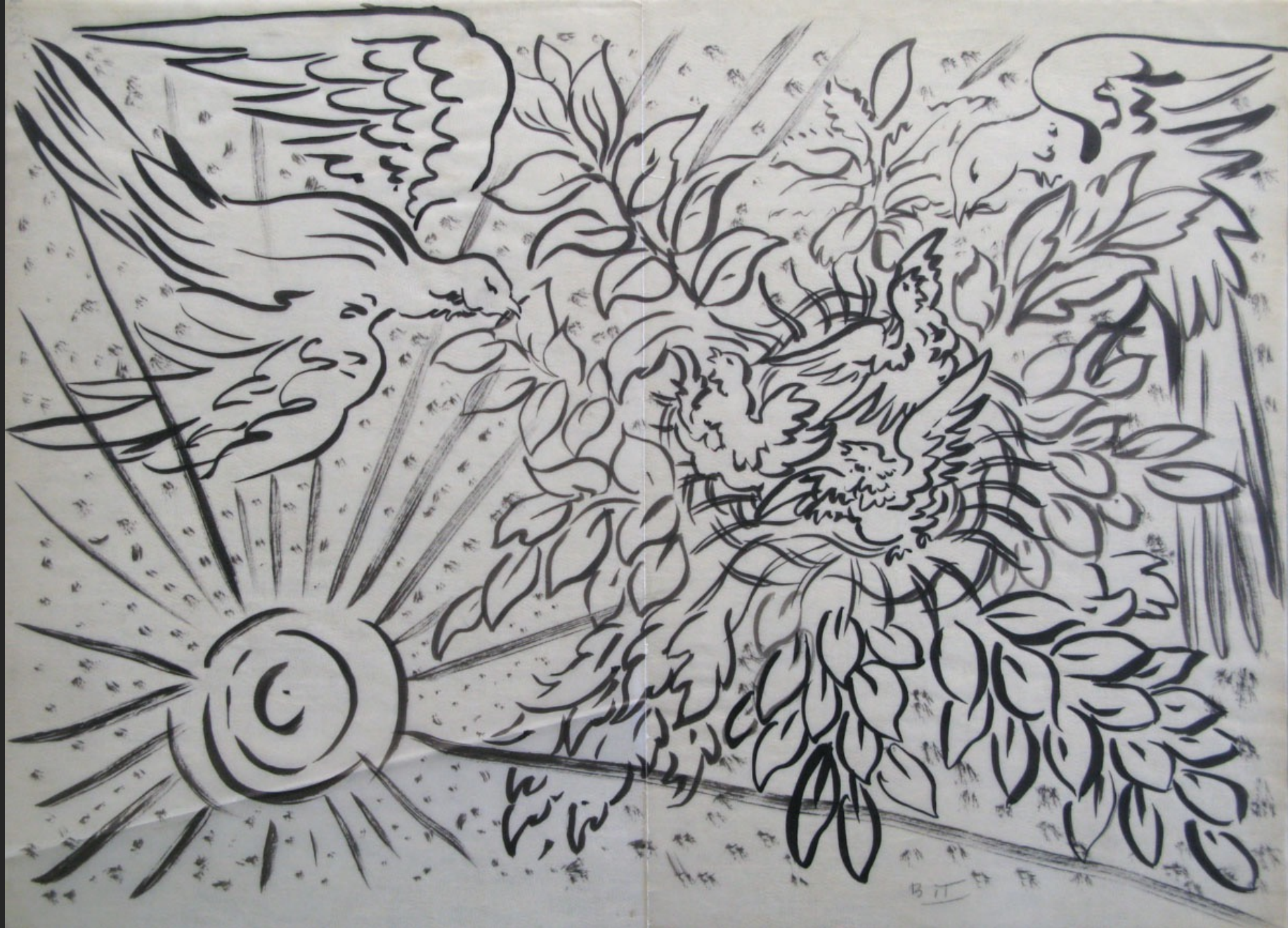
ÉTUDE POUR LE GROUPE SCOLAIRE DE BEZONS -22-, non daté, encre sur calque, 31 x 43,2 cm