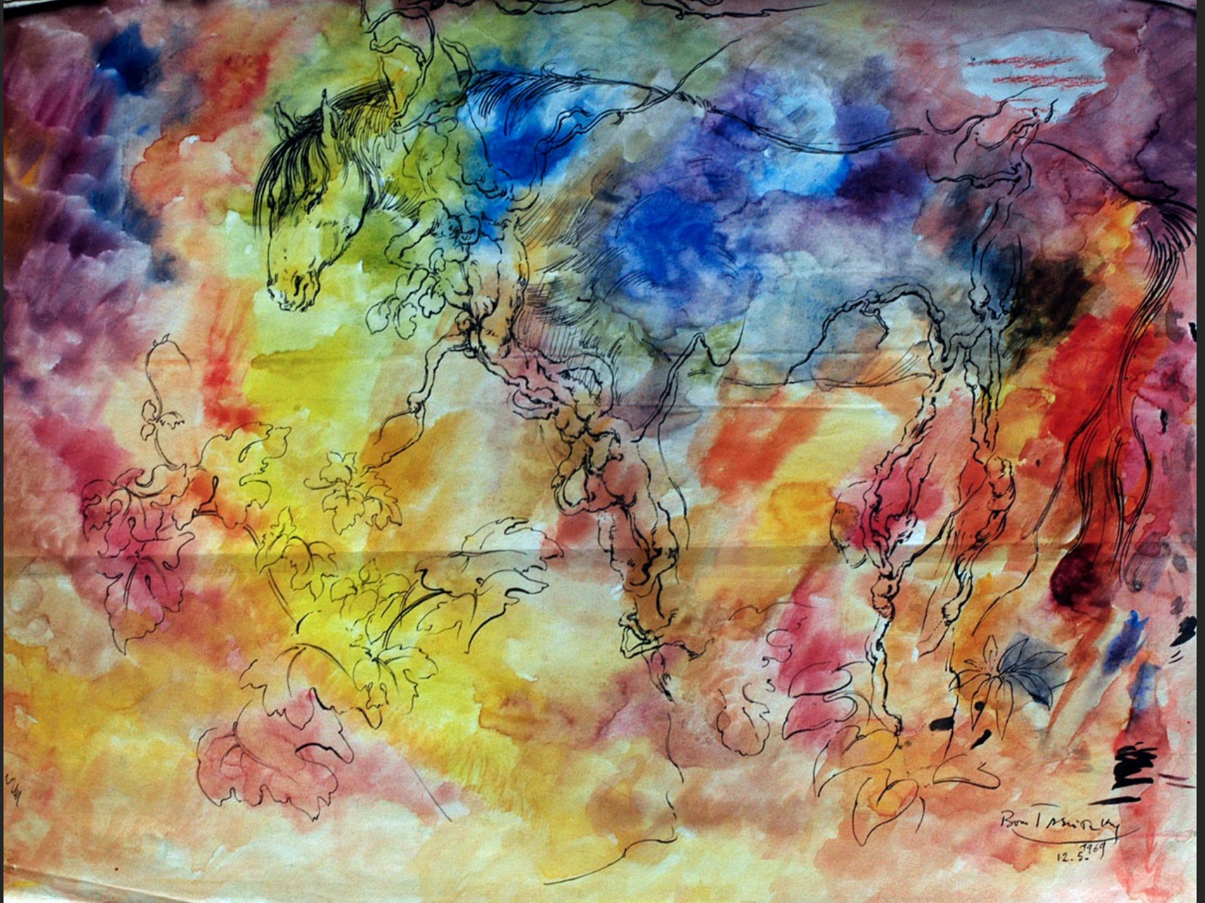
CHEVAL DANS LES ARBRES, 12 mai 1969, encre et aquarelle, 44 x 56 cm