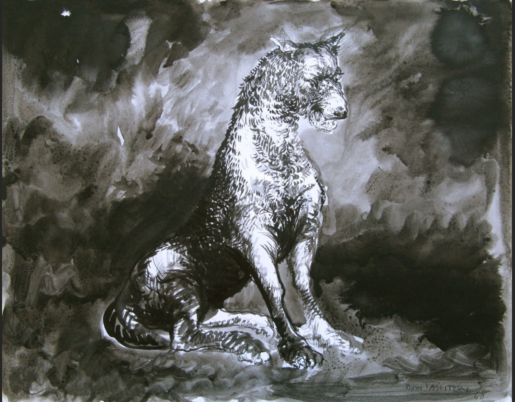
CHIEN ASSIS, 1968, encre et lavis, 32,7 x 41,6 cm