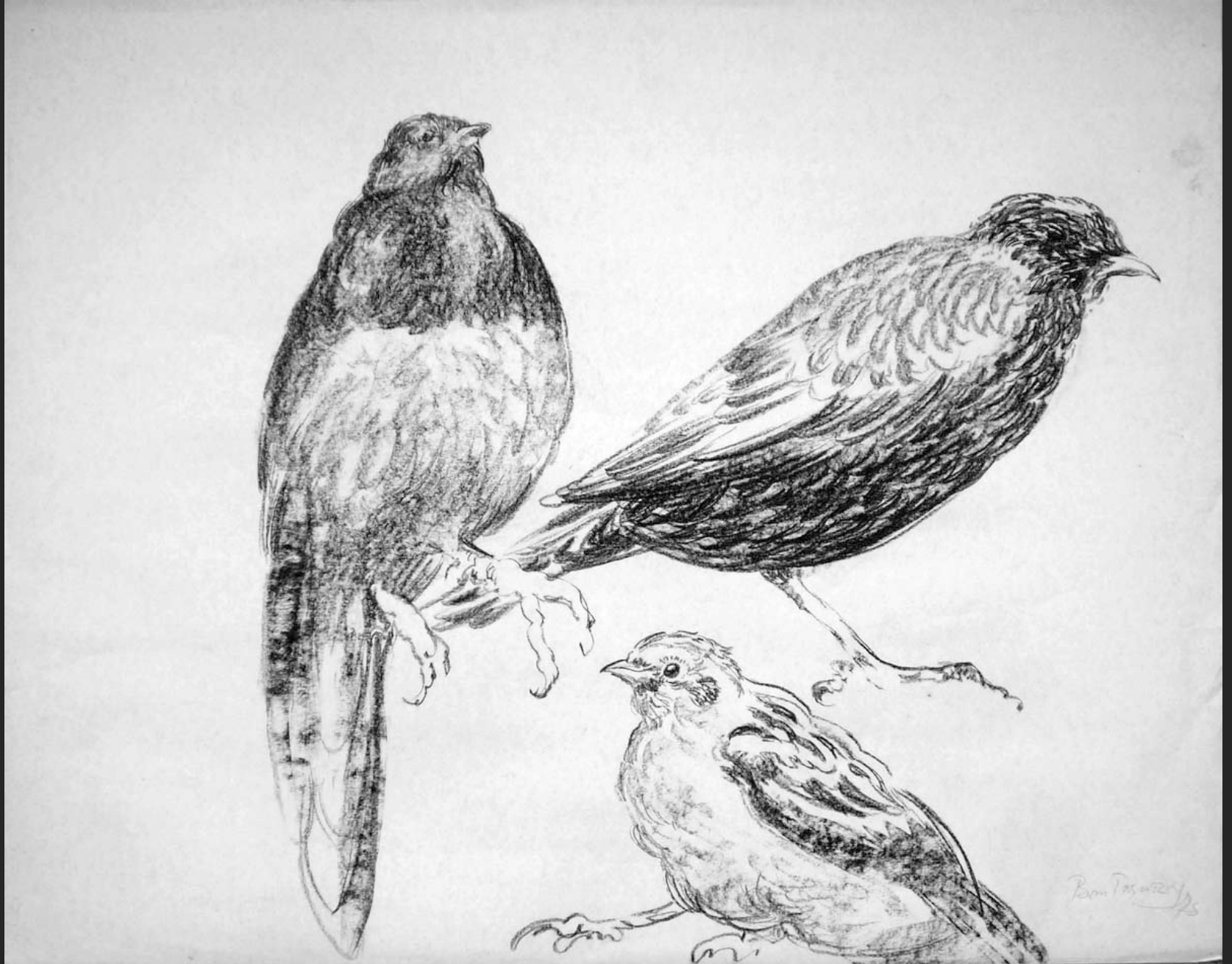
TROIS OISEAUX I, 1975, fusain, 45 x 56 cm