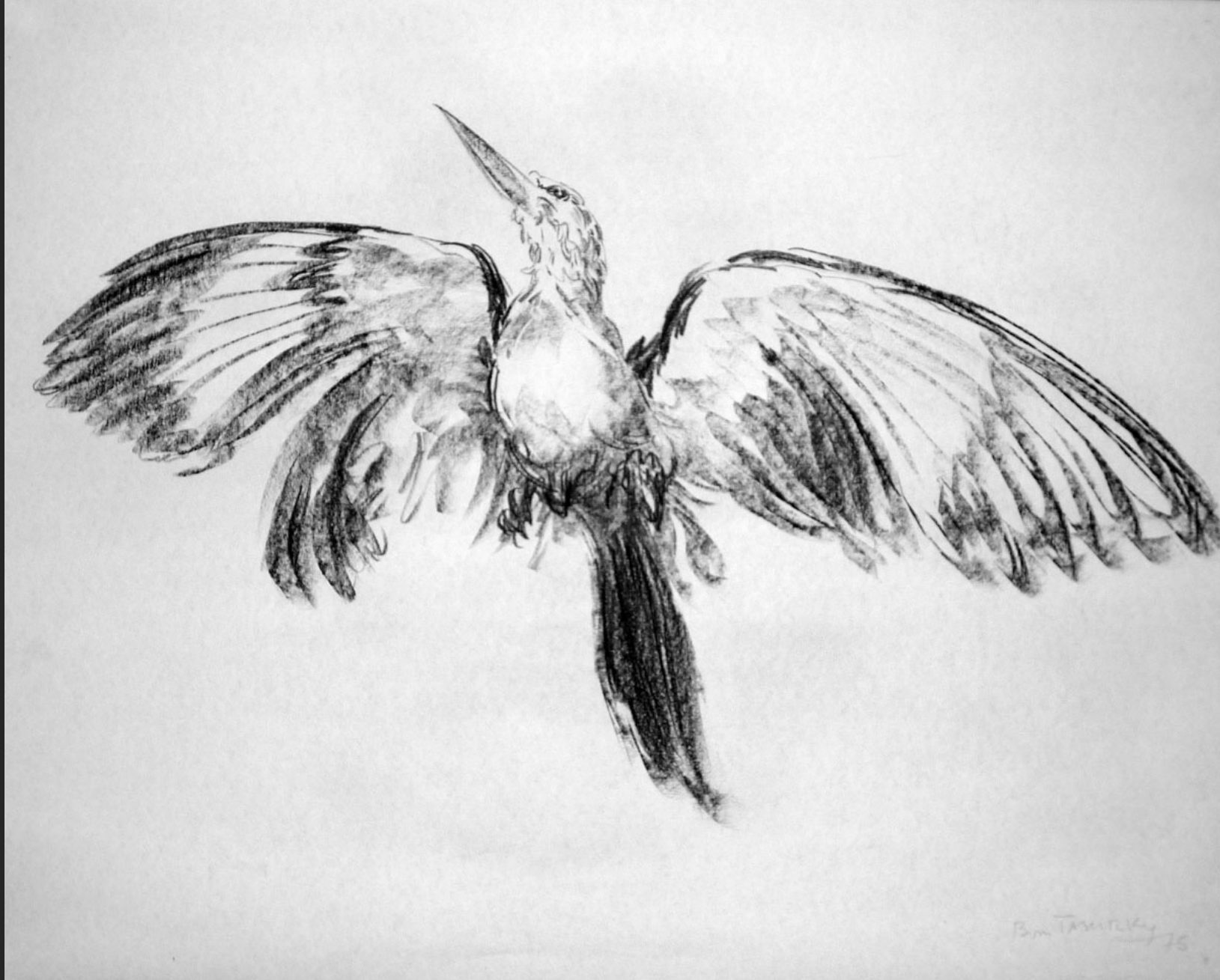
OISEAU EN VOL VIII, 1975, fusain, 45 x 56 cm