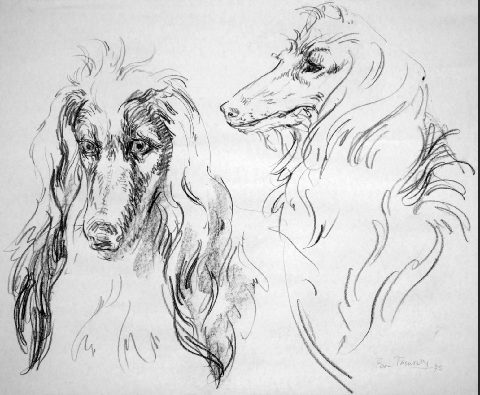
DEUX CHIENS II, 1975, fusain, 45 x 56,5 cm