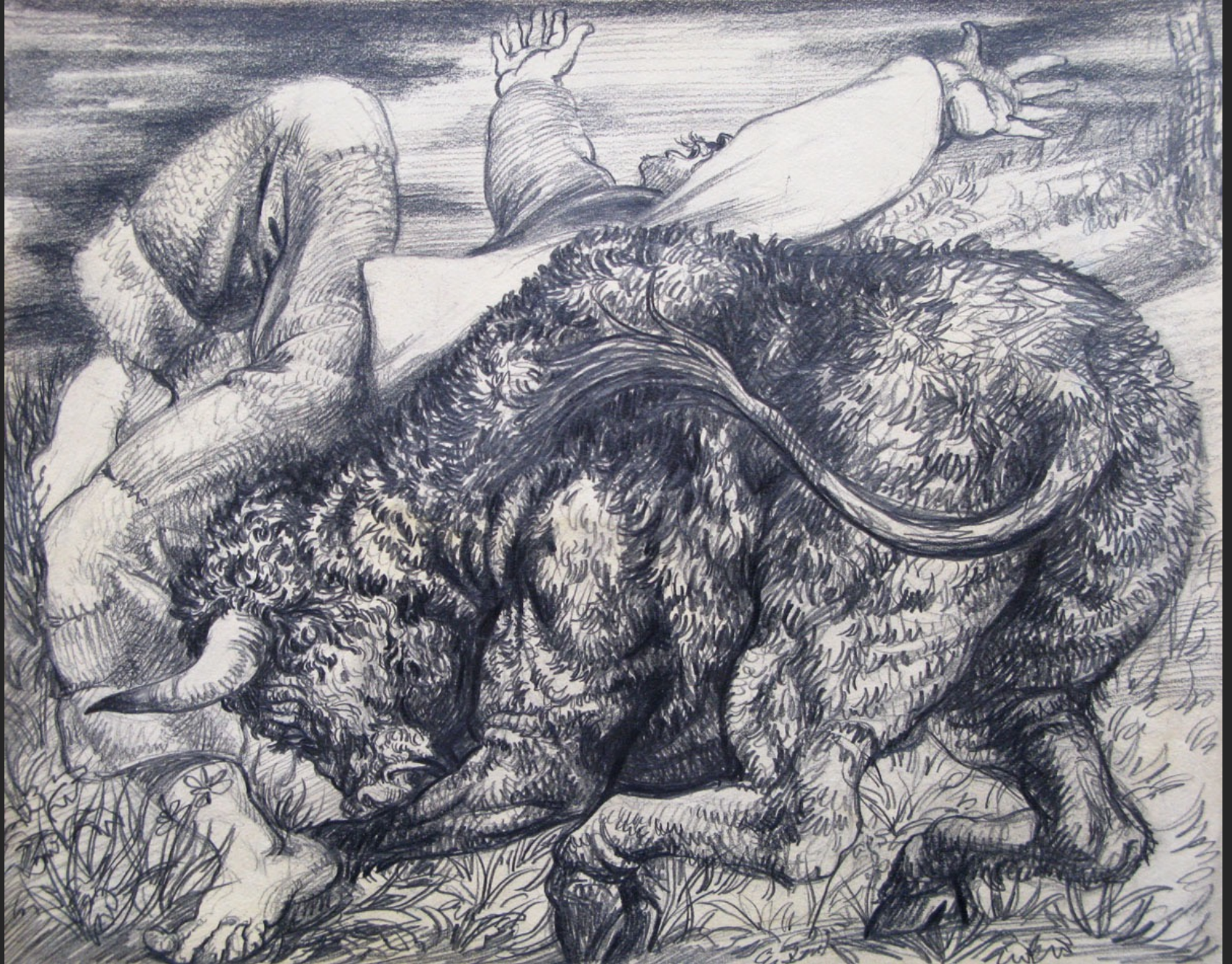
TAUREAU CHARGEANT UN HOMME (PELLÉ LE CONQUÉRANT N°15), non signé, non daté, crayon, 23 x 28,8 cm