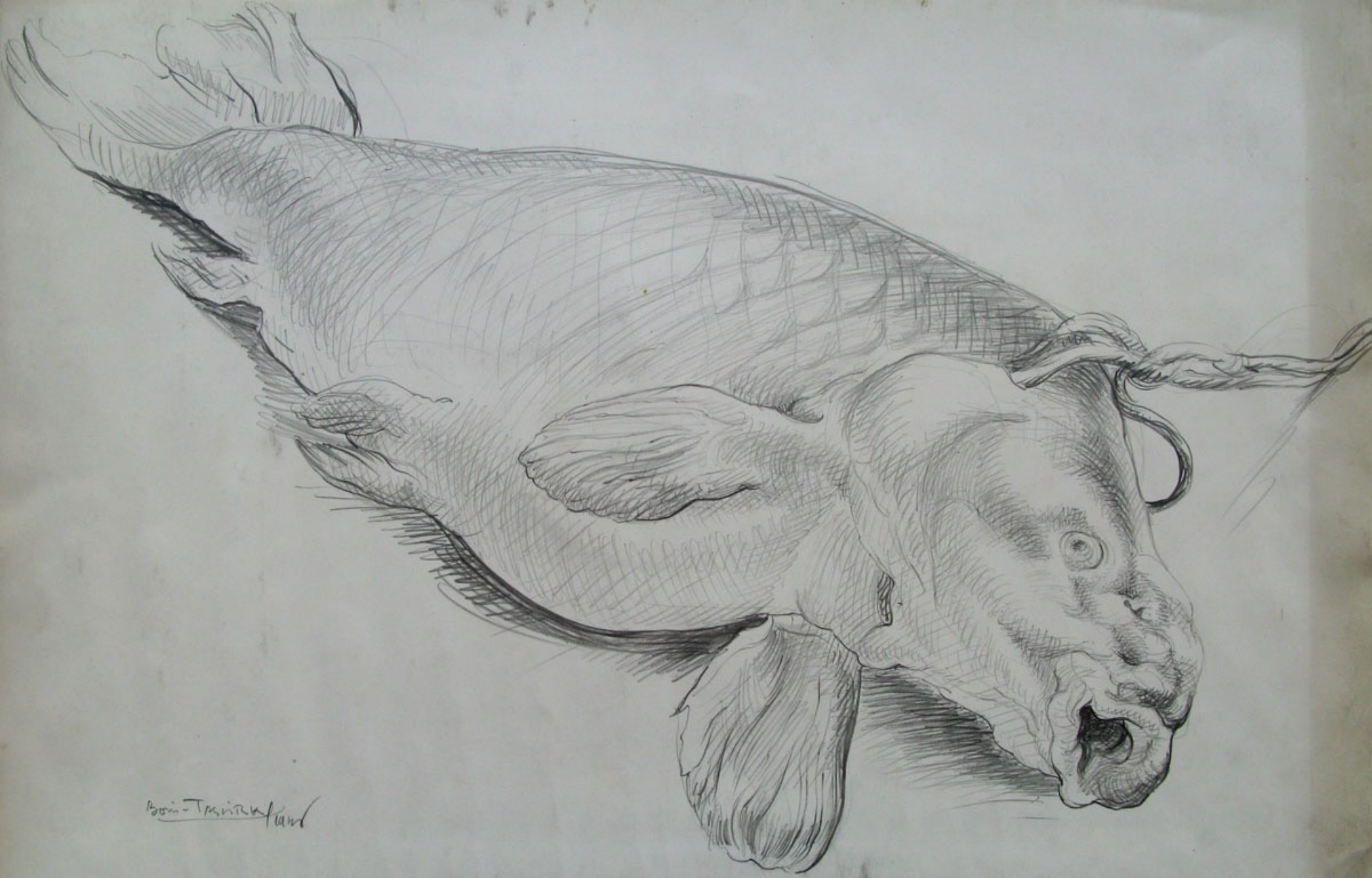
POISSON, 1946, crayon, 32,5 x 49,7 cm