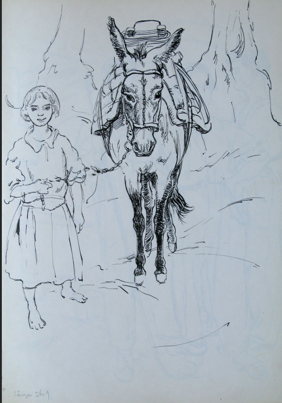
LİNZA JEUNE FILLE ET ÂNE, non signé, 26 septembre 1957, encre, 36,8 x 25,7 cm