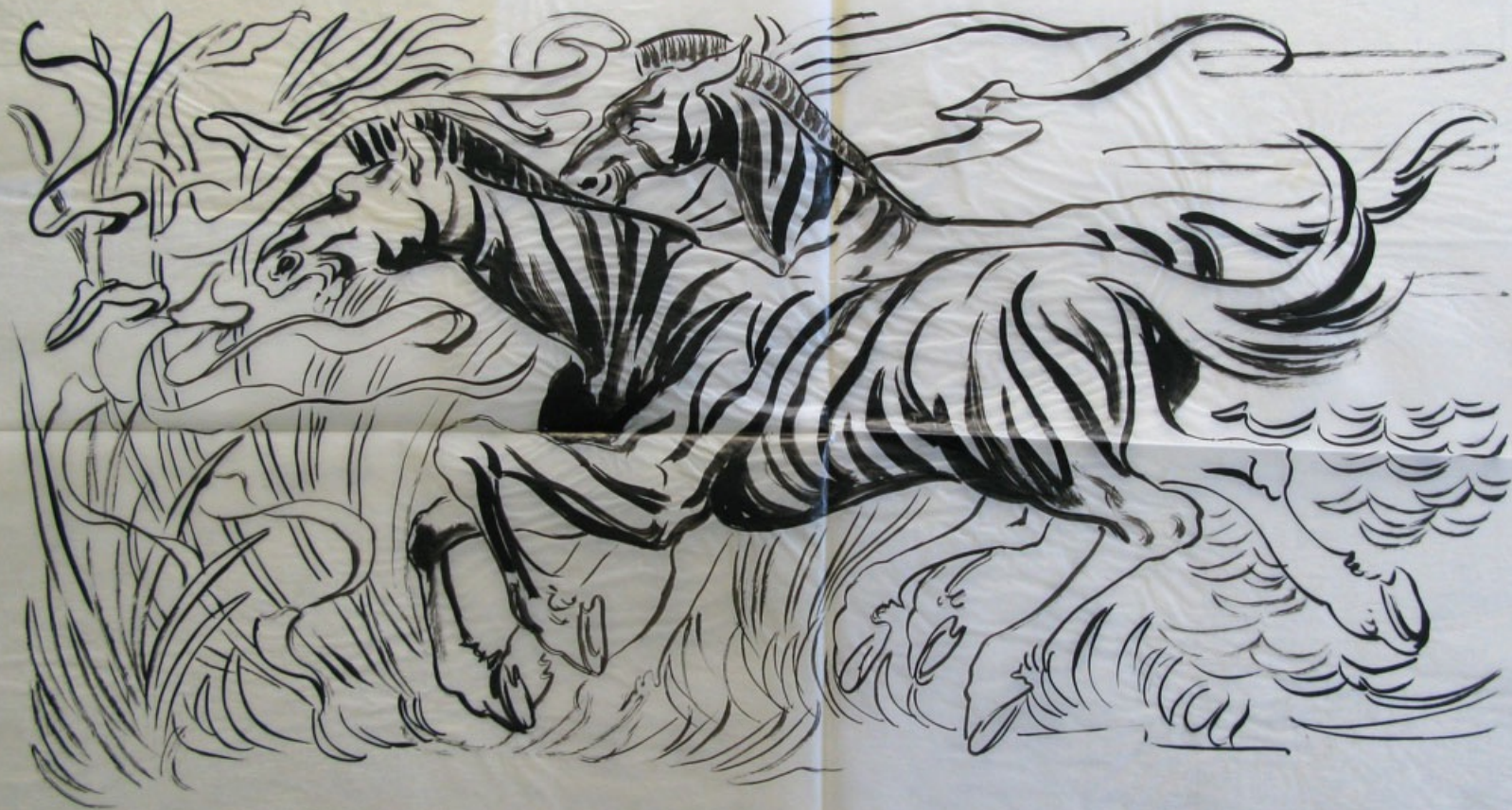
ÉTUDE POUR LE GROUPE SCOLAIRE DE BEZONS -11-, non signé, non daté, encre sur calque , 40 x 69,5 cm