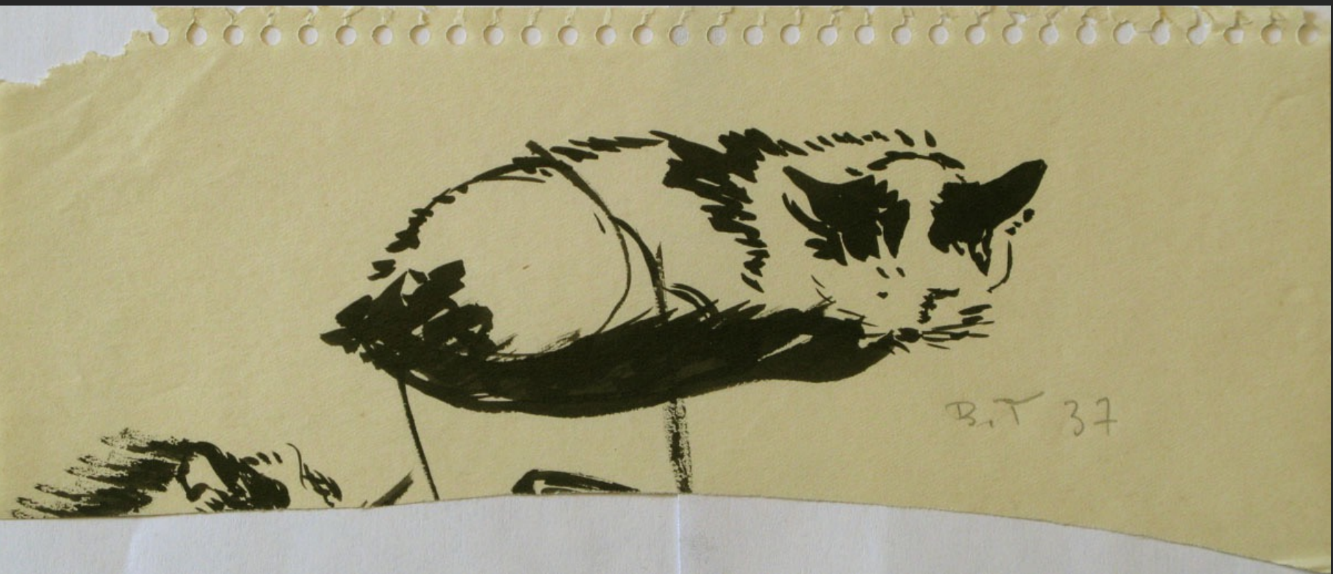
CHAT ASSOUPI, 1937, encre noire, 6 x 18 cm