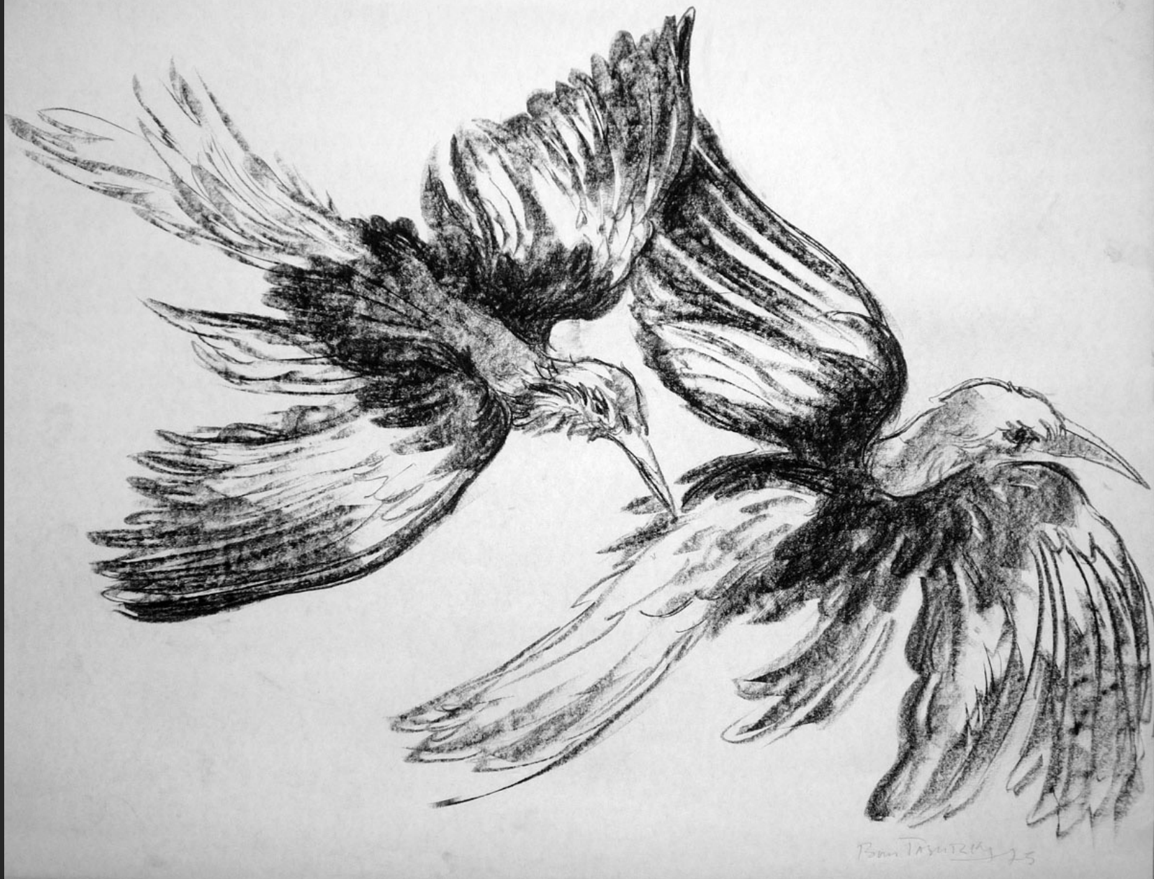
DEUX OISEAUX EN VOL II, 1975, fusain, 45 x 56 cm