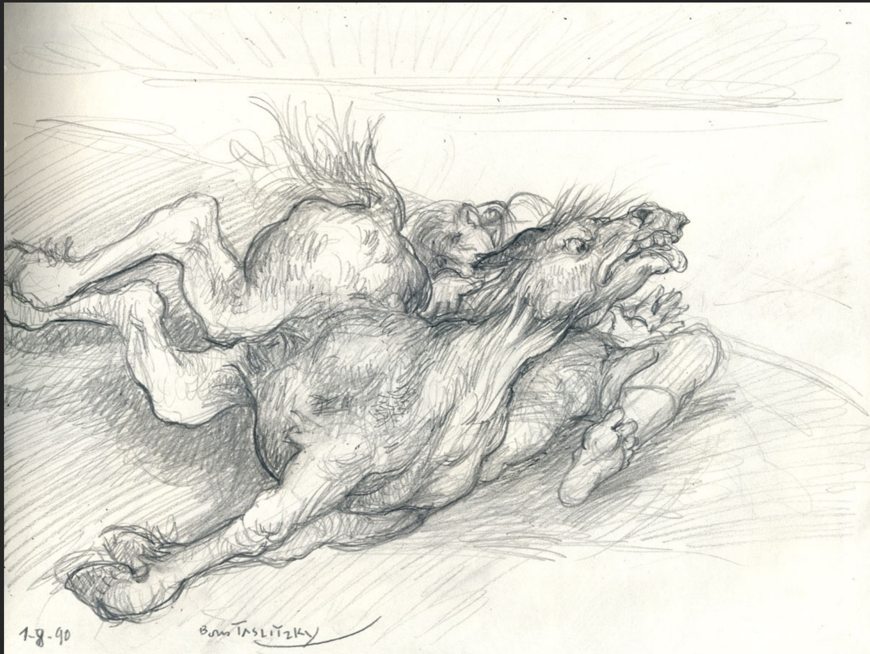
HOMME ET ÂNE TOMBÉS, 1 août 1990, crayon, 20,5 x 26,7 cm