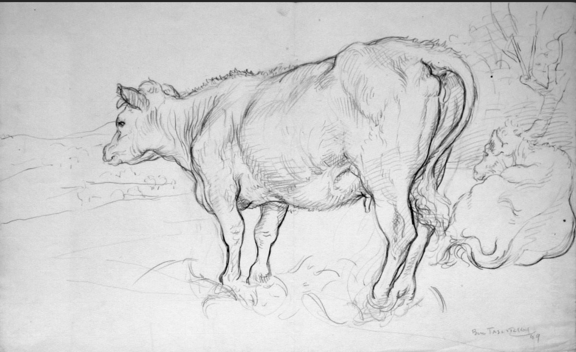
BOVINS, 1949, crayon, 29 x 48 cm