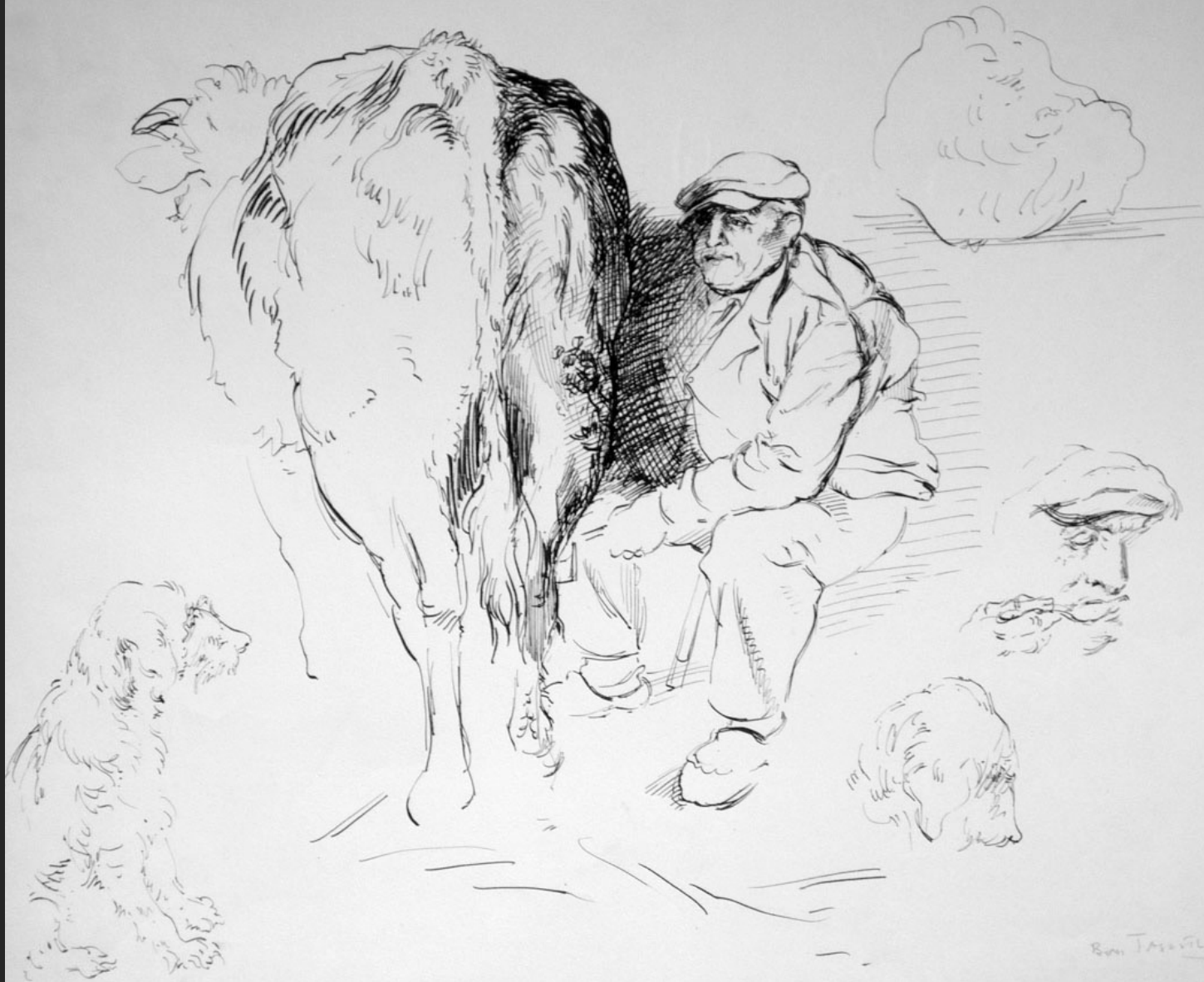
LE PÈRE MORICOUT TRAYANT UNE VACHE, 1949, encre, 37,5 x 47,5 cm