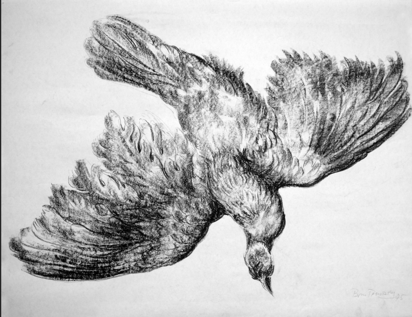
OISEAU EN VOL VII, 1975, fusain, 45 x 56 cm