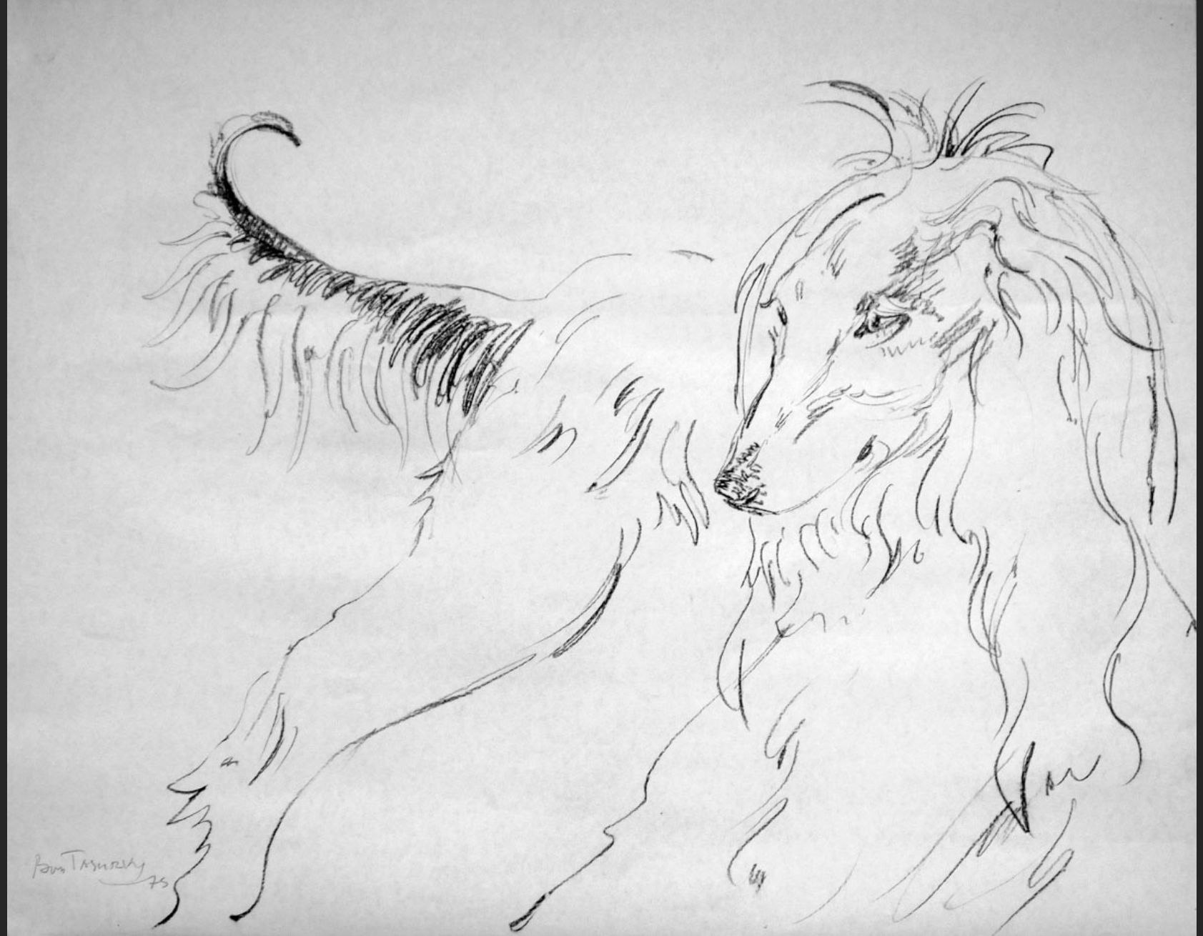
CHIENS I, 1975, fusain, 45 x 56,5 cm