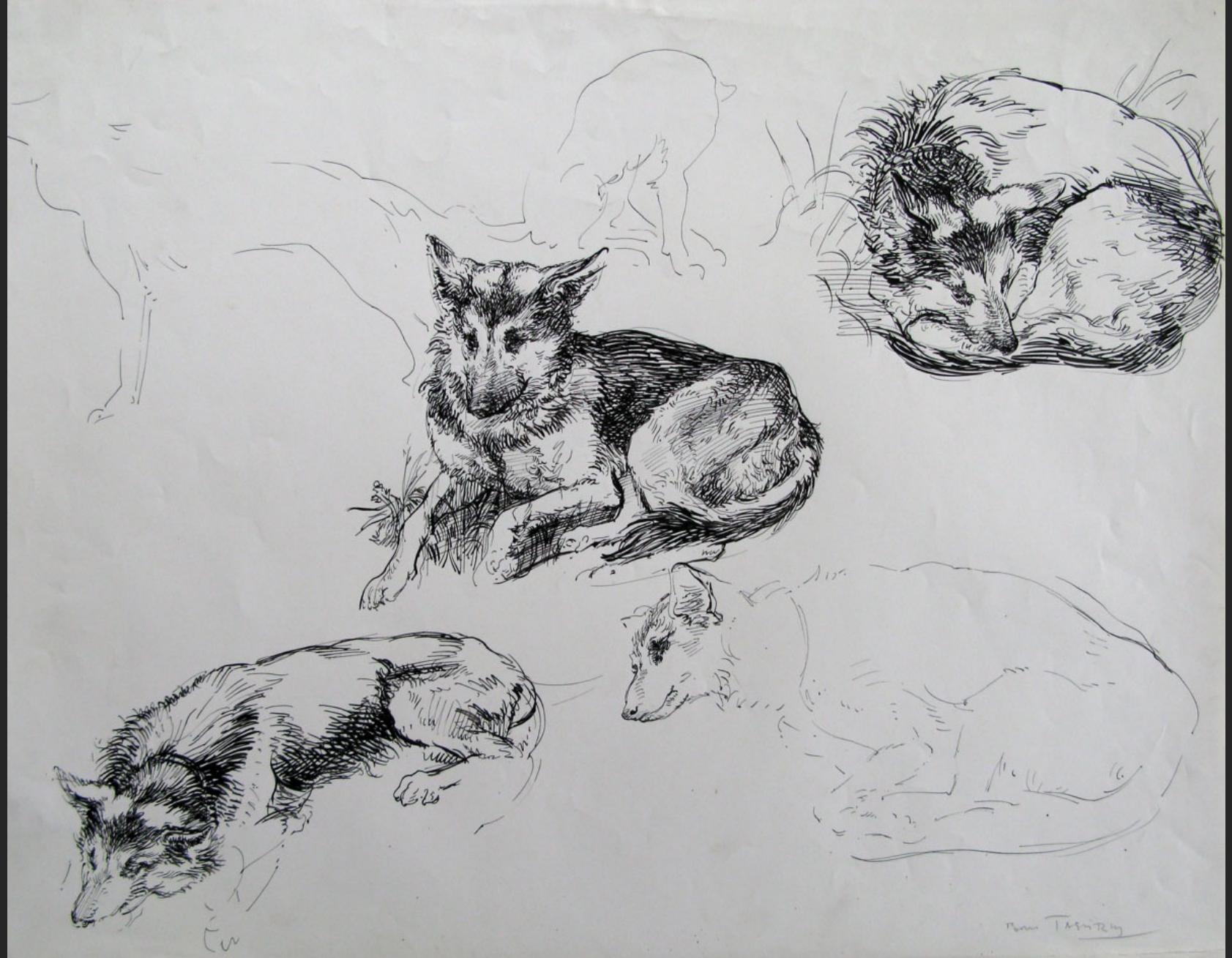
ÉTUDES DE CHIENS (n°8), non daté, encre, 43,2 x 54,8 cm