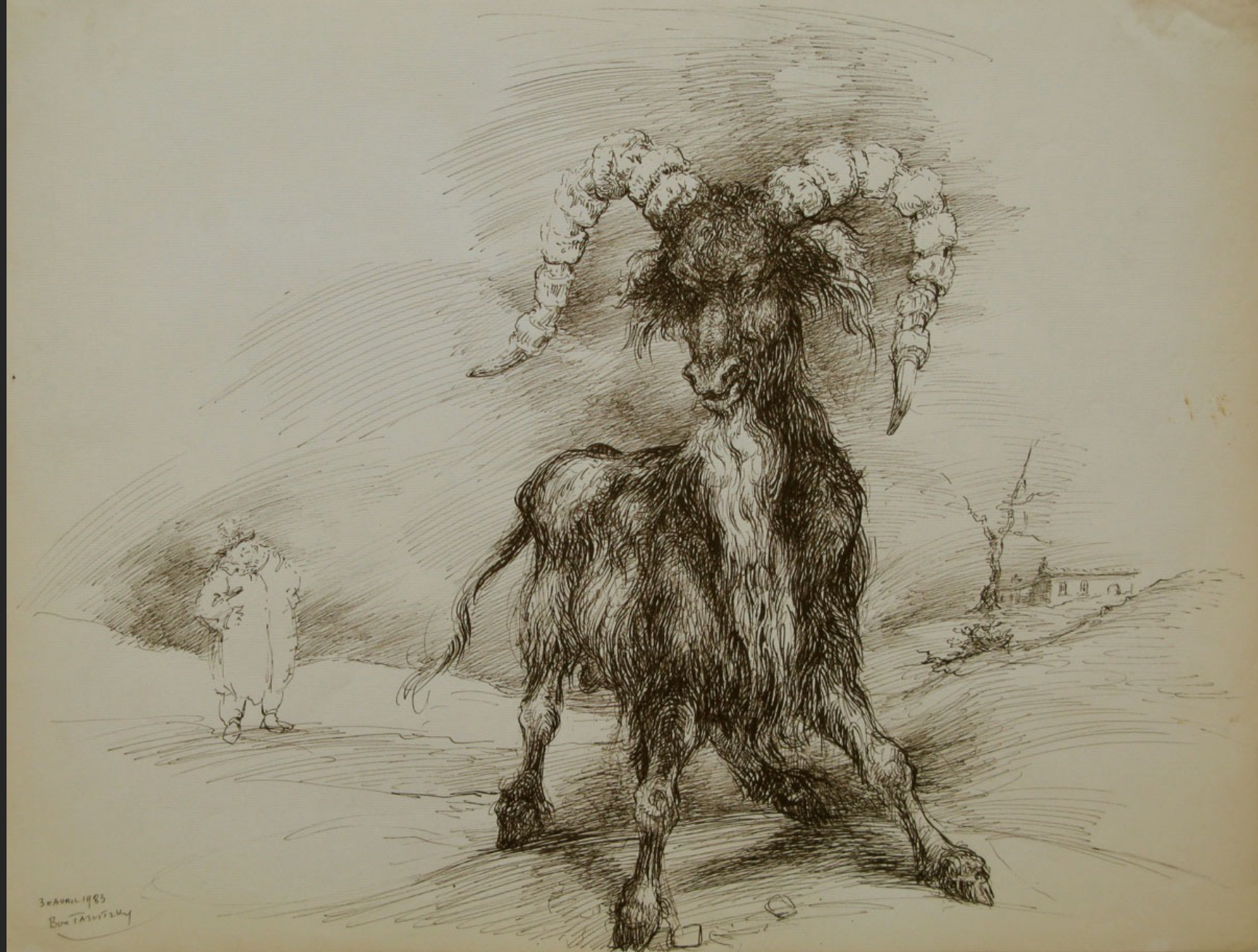
LE GRAND BOUC -1-, 30 avril 1983, encre, 48 x 63,5 cm